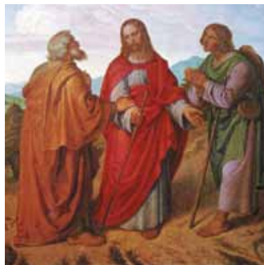
Chrystus ukazuje się uczniom idącym do Emaus