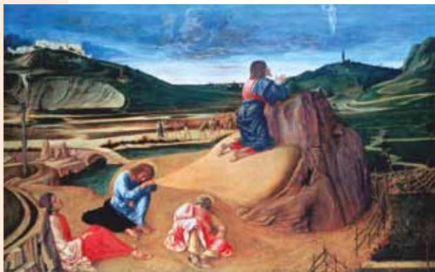
Jezus modlący się w Getsemani

Judasz stał się jednym z tych, którzy pomagali Jezusowi. Był świadkiem Jego cudów, rozmawiał z Nim, jadł i odpoczywał w Jego towarzystwie, otrzymał w Jego towarzystwie moc uzdrawiania i wyrzucania złych duchów. To on był odpowiedzialny za pieniądze, z których apostołowie korzystali wspólnie. Świadczy to o zaufaniu, jakim go darzyli. Ale mimo to zdradził ich i przede wszystkim swojego Mistrza.