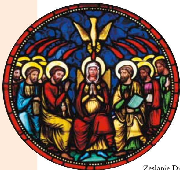
Zesłanie Ducha Świętego