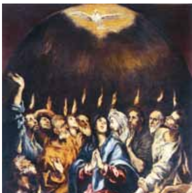
Zesłanie Ducha Świętego